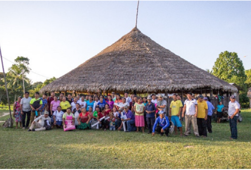
Mkutano wa Wapichan, Parabara, ukiwa umeandaliwa na South Rupununi District Council (Baraza la Wilaya ya Rupununi Kusini), Guyana.

Nchini Guyana , kazi ya muda mrefu ya FPP na Wapichan imeunga mkono jamii hiyo kuweka ramani ya ardhi zao kikamilifu na kuweka mpango wa matumizi endelevu na usimamizi wa eneo lao 20 . Wapichan wamehusika katika mazungumzo rasmi na serikali ya Guyana kwa lengo la kupata hati miliki za kisheria kwa eneo lao la pamoja na kuunda Msitu Mkubwa wa Jumuiya Ulihifadhiwa juu ya msitu wa mvua wa zamani katika bonde la Upper Essequibo, wakitumia mfumo wa kisheria uliotolewa na Sheria ya Amerindian ya 2006 21 . Mazungumzo ya hati miliki kwa Wapichan bado hayajatatuliwa. Mfano wa pili kutoka Guyana ni Eneo la Uhifadhi Linalomilikiwa na Jamii la Konashen (COCA) 22 , ambalo ni la watu wa Wai Wai Amerindian. Eneo hili tayari limeanzishwa, lakini Wai Wai wameelezea malalamiko juu ya kanuni zinazosimamia usimamizi wa COCA kwa misingi kwamba ziliundwa na NGOs za uhifadhi wa nje bila michakato yenye ufanisi na inayofaa kitamaduni ya idhini huru, ya awali na yenye ufahamu (FPIC) juu ya utawala wa usimamizi wa eneo lililohifadhiwa 23 . Hivyo, masomo muhimu yanaweza kutolewa kutoka kwa uundaji na usimamizi wake.