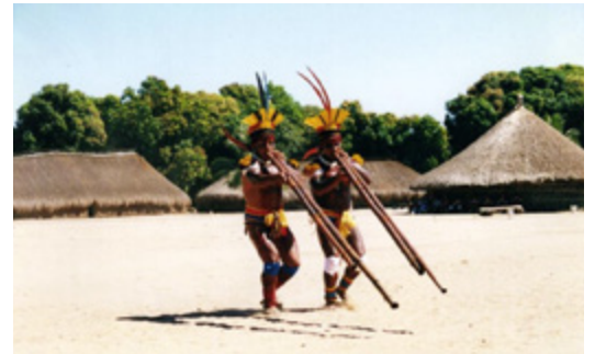
Kijiji cha Kamaiurá katika Hifadhi ya Wenyeweji ya Xingu (Xingu Indigenous Park).

Mnamo miaka ya 1990, watu wa kiasili wa Xingu waliunda Jumuiya ya Ardhi ya Kiasili ya Xingu (ATIX) kufanya kazi kama taasisi yao ya uwakilishi katika majadiliano na serikali, kama sehemu ya hatua kuelekea uhuru zaidi. Leo, vikundi vya kiasili bado wanafanya kazi pamoja na kujaribu kuziba tofauti, pamoja na kuunda Mpango wa Usimamizi wa Eneo uliojengwa kwa makubaliano kwa ajili ya maisha yao ya kitamaduni na kiuchumi ya baadaye na ulinzi wa mazingira yao.