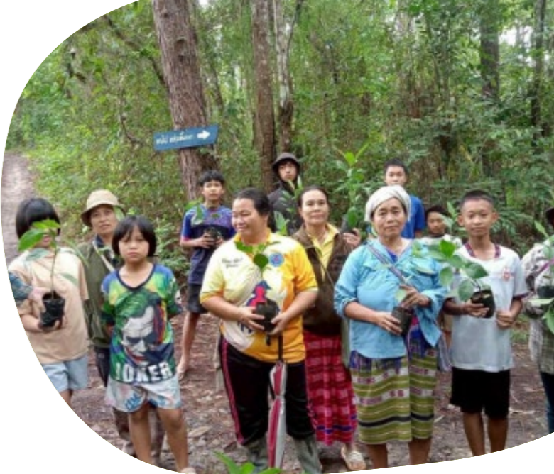
การปลูกพืชสมุนไพรและพืชย้อมสีธรรมชาติในป่าชุมชน โดยผู้หญิง ชาวชน และผู้ช่วยชาวของชุมชน