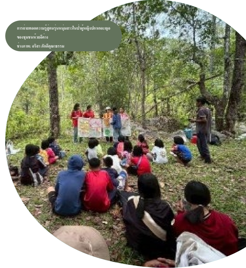
การถ่ายทอดความรู้สู่คนรุ่นใหม่เกี่ยวกับคุณค่าของชุมชนหัวอังกาจ