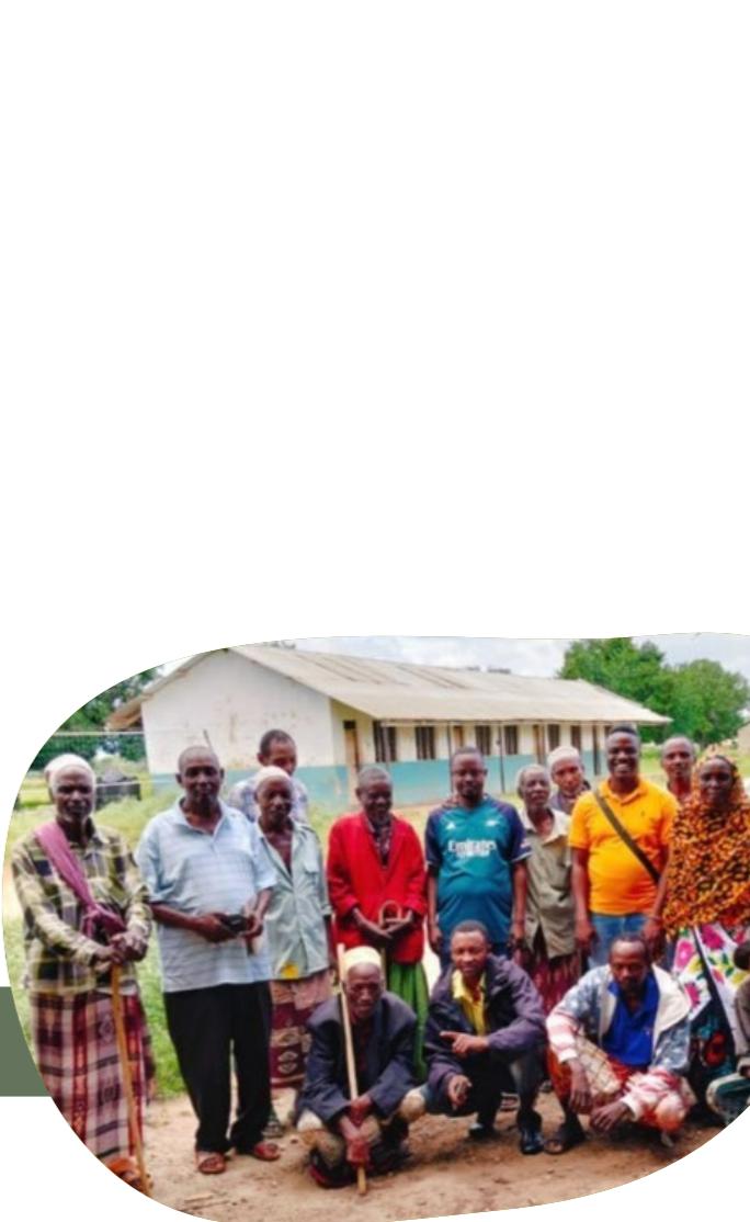
การประชุมเพื่อการเข้าถึงชุมชนในวันที่ 15 กรกฎาคม 2568 อภิปรายเกี่ยวกับกรรักษารักษาสันติภาพการอนุรักษ์วัฒนธรรม และการสนับสนุนที่ดินรางภาค: CIPDP

ด้วยการสนับสนุนของ LMPD และฝ่ายอื่น ๆ ชุมชนอาเวียร์และซานเยได้เข้ามีส่วนร่วมมากขึ้นในสิทธิในที่ดินและการสนับสนุนงานอนุรักษ์ พวกเขากำลังผลักดันให้มีการจดทะเบียนที่ดินและการยอมรับเขตแดนตามประเพณีของพวกเขา เป็นไปได้มากกว่าในฐานะ ITTs หรือ ICCAs อย่างไรก็ตาม การมีส่วนร่วมของพวกเขาถูกจำกัดโดยการขาดการยอมรับทางกฎหมายของสิทธิในที่ดินชุมชนของพวกเขา ข้อจำกัดในการเข้าถึงป่าไม้ และการขาดการมีส่วนร่วมอย่างมีความหมายในแผนงานอนุรักษ์ที่จัดการโดยรัฐ