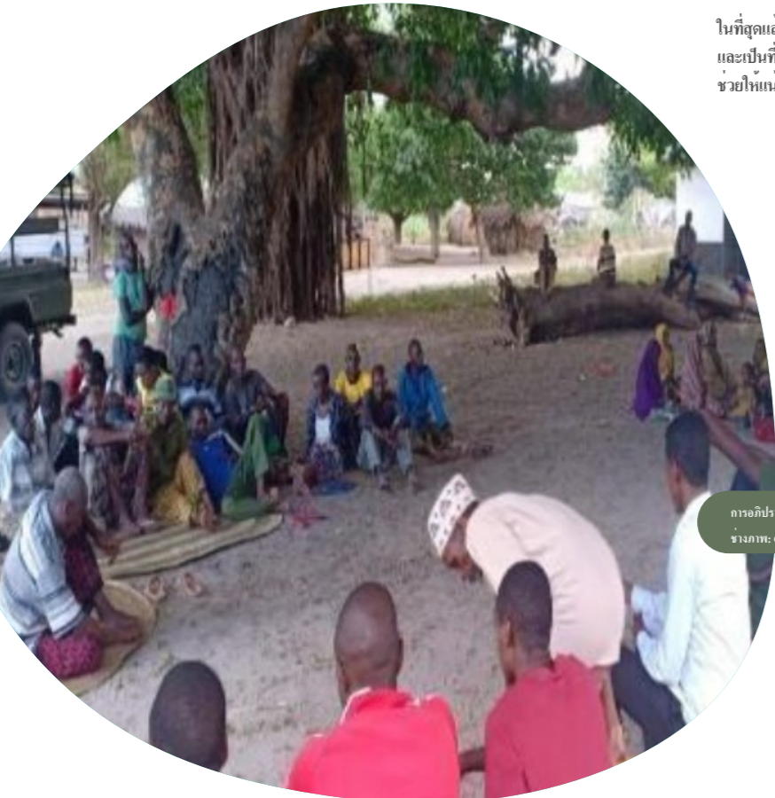
การอภิปรายของชุมชนว่าด้วยทางเลือกเพื่อการยอมรับการอนุรักษ์ที่นำโดยชนเผ่าพื้นเมืองในเดือนกรกฎาคม 2568

ในที่สุดแล้ว ในขณะที่ OECMs สามารถเสริมการอนุรักษ์ที่นำโดยชุมชนในบางบริบท วิถีทางเบื้องต้นและเป็นที่ยอมรับที่สุดสำหรับชาวอาเวียร์และซานเยคือการยอมรับ ITTs ของพวกเขา เนื่องจากนี้ช่วยให้มั่นใจถึงความยุติธรรม สิทธิ และการดูแลสุขภาพหลายทางชีวภาพที่ยั่งยืน