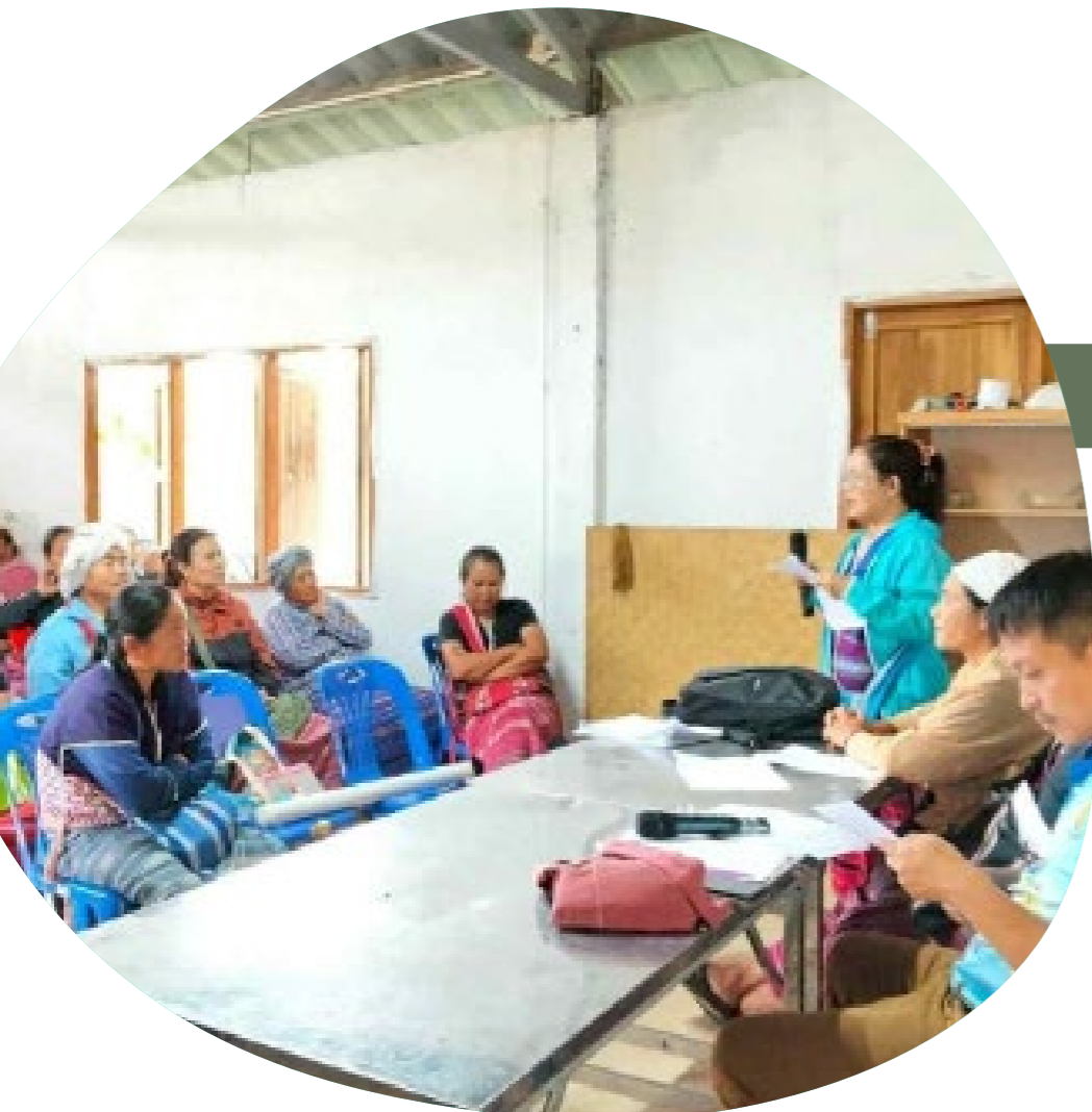
การประชุมเพื่อทบทวนระเบียบข้อบังคับของชุมชนหัวอังกาจ

การรับรอง ITTs ในฐานะแนวทางที่แยกต่างหากเป็นการให้เกียรติความเป็นผู้นำและสิทธิของชนเผ่าพื้นเมือง และเป็นการรับประกันว่าเป้าหมายที่ 3 จะถูกดำเนินการด้วยวิธีที่อิงตามสิทธิ ยั่งยืน และยึดตามวัฒนธรรม นอกจากนี้ยังช่วยสนับสนุนรัฐบาลในการดำเนินการและบรรลุเป้าหมายที่ 3 อีกด้วย ซึ่งหมายความว่ารัฐบาลสามารถนำความพยายามของชุมชนรวมในรายงานระดับชาติของตนได้