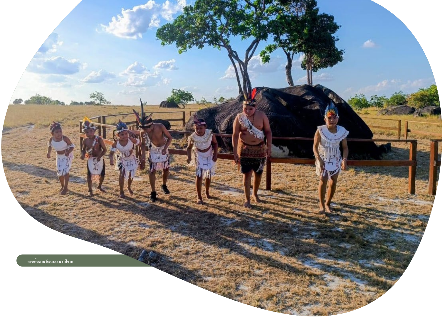
การเดินตามวัฒนธรรมวาปีชาน

การบรรยายสรุปนี้ได้รับการพัฒนาขึ้นเป็นส่วนหนึ่งของโครงการวิถีการอนุรักษ์