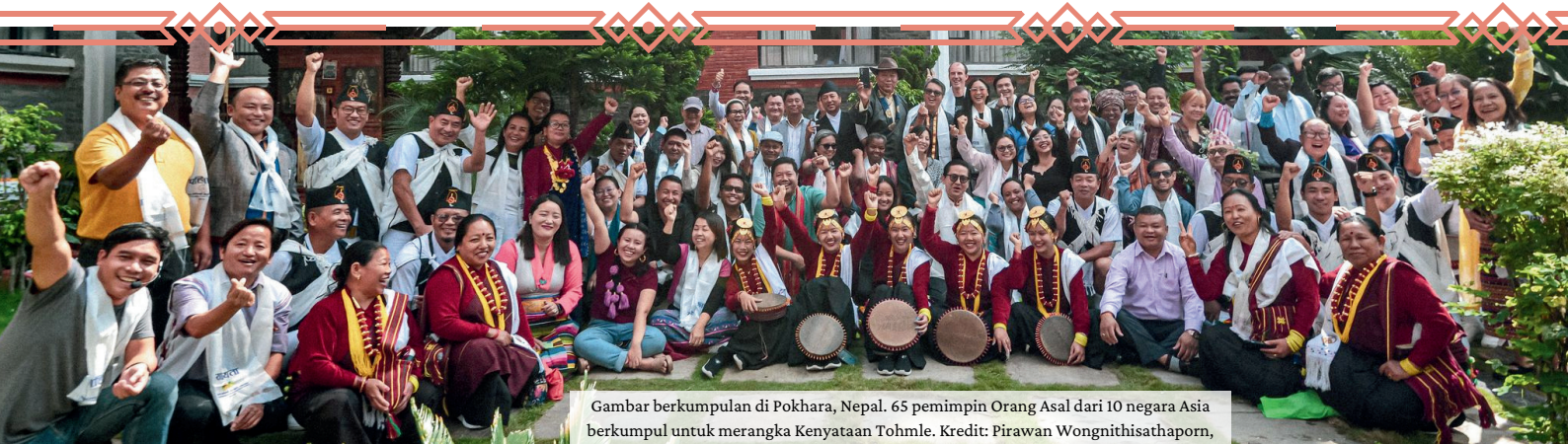
Gambar berkumpulan di Pokhara, Nepal. 65 pemimpin Orang Asal dari 10 negara Asia berkumpul untuk merangka Kenyataan Tohmle.

Daytoy nga pablaak ket napadur-as iti maika-uppat (4th) a kumperensya ti nainsigudan a kaammuan ken tattao iti Asya wenno ti Indigenous Knowledge and Peoples of Asia (IKPA). Ti kumperensya iti Nainsigudan a karbengan ti tattao, ti biodibersidad ken ti panagbalbaliw ti klima a naisayangkat manipud iti umuna nga aldaw ti Oktubre inggana maika-uppat(4th) nga aldaw idiaiy Pokhara, Nepal.