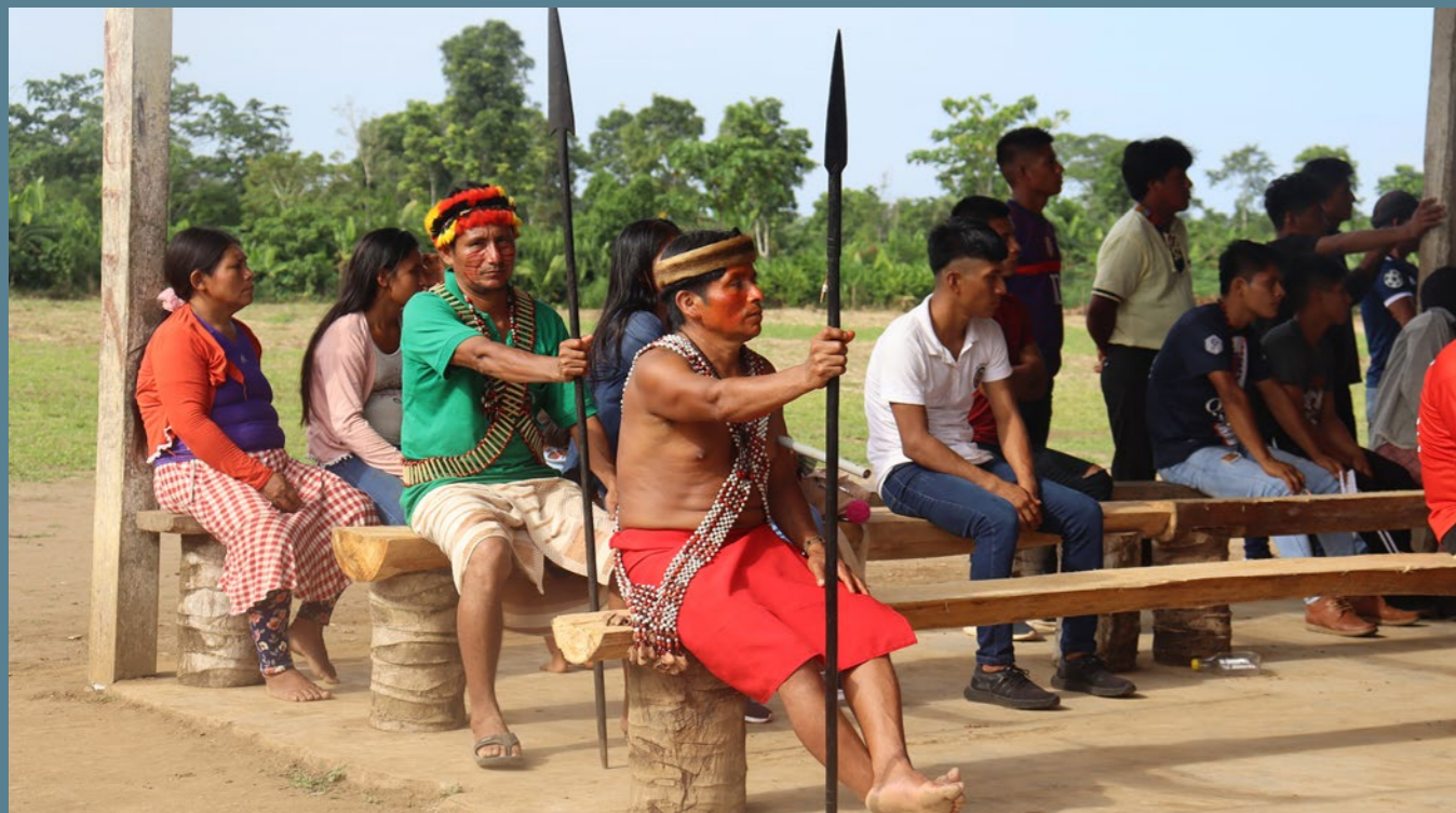
Mkutano wa Wampis huko Kankaim.

Kazi nchinu Peru inalenga kuimarisha mipango ya jamii asilia ya kulinda bayoanuwa na kutawala maeneo yao katika maeneo ya Andean-Amazon. Hii ni Pamoja na utumiaji na uwekaji kumbukumbu wa mbinu za kitamaduni za kilimo cha Andean-Amazonian na mfumo ya utoaji inayotegemea maeneo.