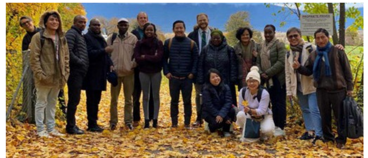
Viongozi wa jamii asilia huko Geneva kabla ya warsha kuhusu Indigenous Navigator, Novemba 2023.