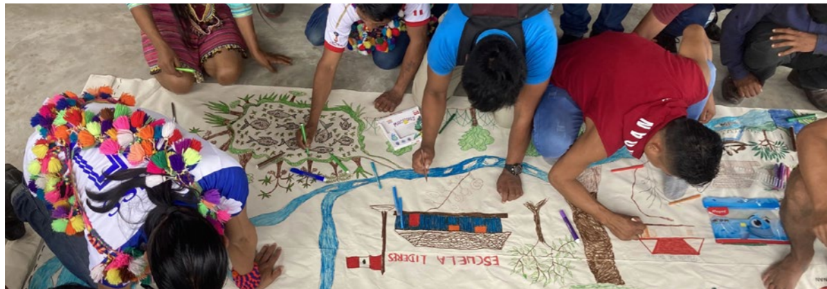
Wanafunzi wakipata mafunzo kutoka kwa mafunzo yao ya uongozi, moja kati ya 5 yaliyoendeshwa kwa mwaka moja na LifeMosaic kwa Shule ya Uongozi ya Shawi nchini Peru.