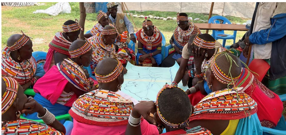
Wenyeji wa Samburu wakifanya Ramani ya Rasilimali za Jamii huko Kiltamany.