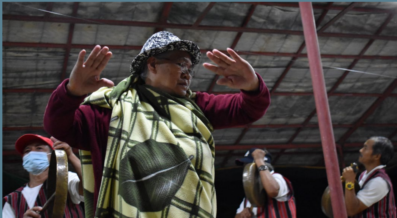
Mzee wa Ibaloy akicheza ngoma ya kitamaduni pamoja na wanajamii wa Ikalahan wakati wa sherehe za kitamaduni zilizofanyika Nueva Viscaya, Ufilipino.

Shughuli nchini Ufilipino zinalenga kujifunza kwa msingi wa jamii, usambazaji wa maarifa kati ya vizazi na ukuzaji wa elimu katika mikondo mitano muhimu ya kazi: mifumo ya chakula na Maisha jadi; afya na ustawi; uongozi wa vijana; sauti za kiasili katika sana ana fasihi; na ushiriki wa kitaifa na kimataifa na utetezi wa sera.