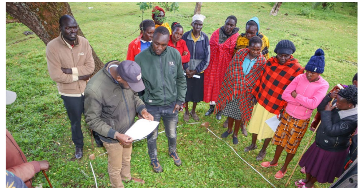
Maonyesho ya mbinu ya quadrat ya ukusanyaji wa data na CIPDP. Novemba 2023.