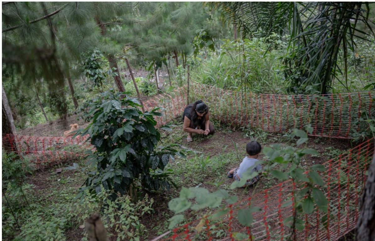
Watu wa Yanesha hukuza mboga katika bustani ya kibaolojia ya familia. Muungano wa Jumuiya ya Wenyaji La Selva, Wilaya ya Villa Rica, Mkoa wa Oxapampa, Mkoa wa Pasco, Peru.