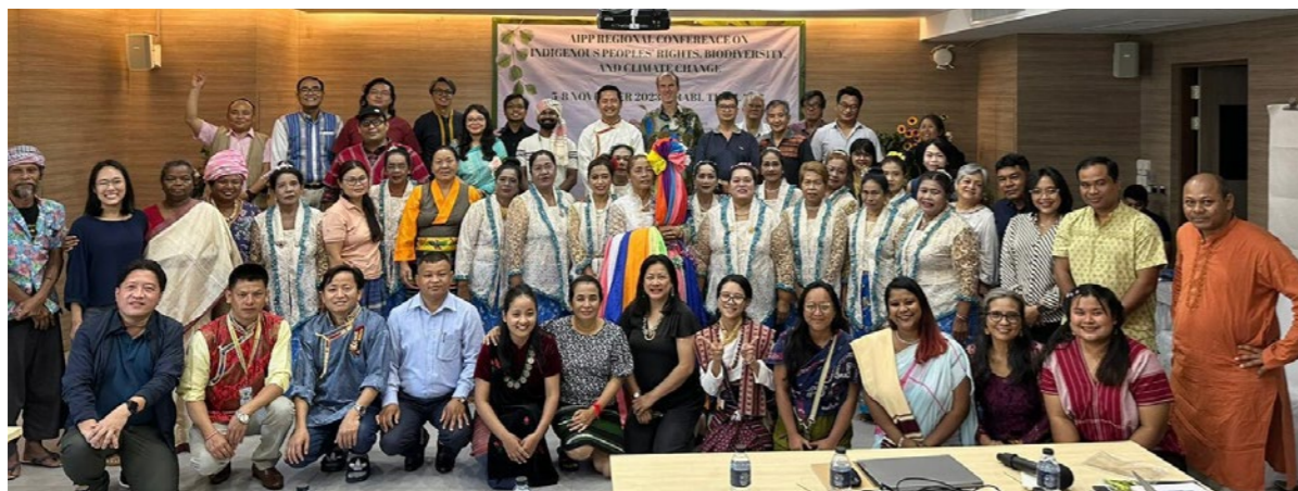
Picha ya pamoja ya washiriki wa Mkutano wa Krabi. Washiriki wa Kongamano walipitisha Azimio la E-Sak Ka Ou. Oktoba 2023.