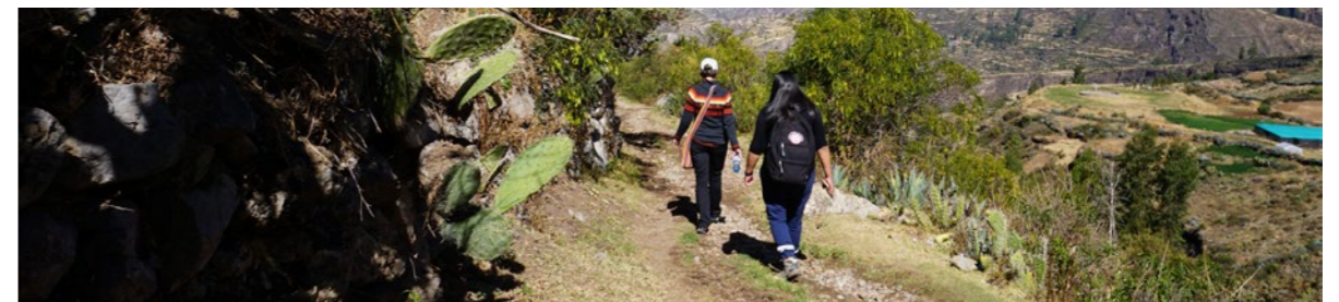
Wafanyakazi wa FPP wanatembelea washirika wa CHIRAPAQ huko Ayacucho.