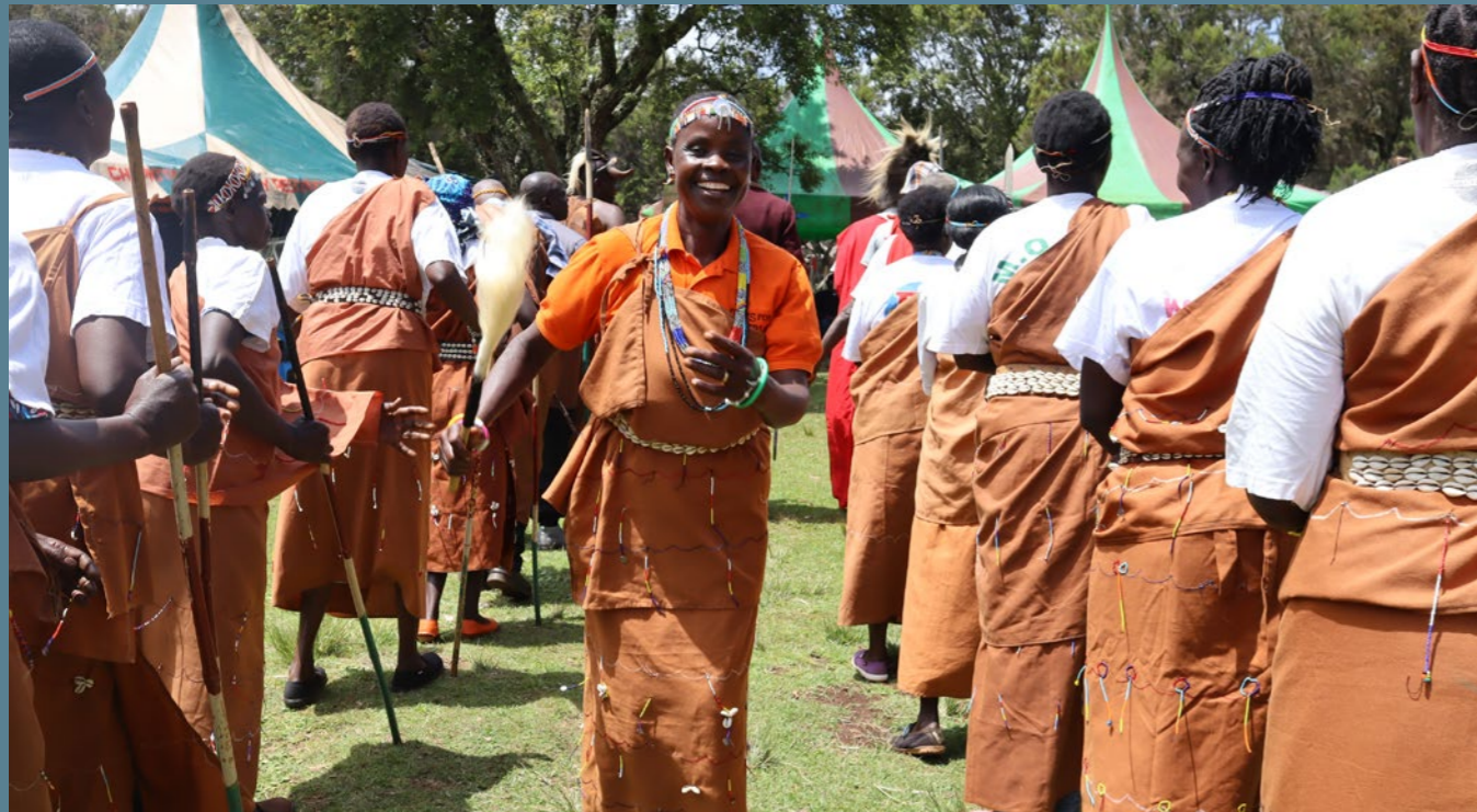
Wanawake wa Ogiek wenye furaha wakishereheka siku ya jamii asilia Duniani Novemba 2023, Mlima Elgon.

Nchini Kenya, mrasi umeundwa ili kujenga mfumo shirikishi wa kusaidia utekelezaji wa kitaifa wa CBD. Itafanya hivi kupitia kupachika michango ya jamii na wazawa katika mikakati ya kitaifa na kuripoti.