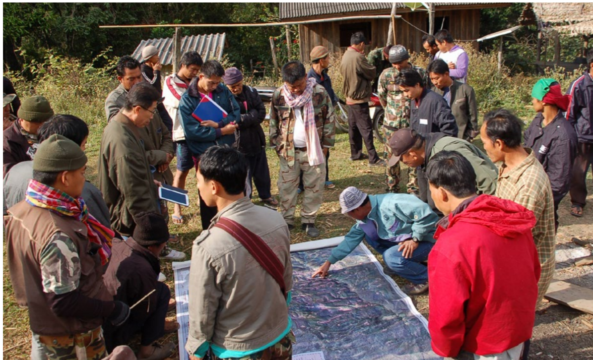
Kutumia Ramani kushughulikia suala la Kupanua Maeneo ya Kilimo, Thailand.