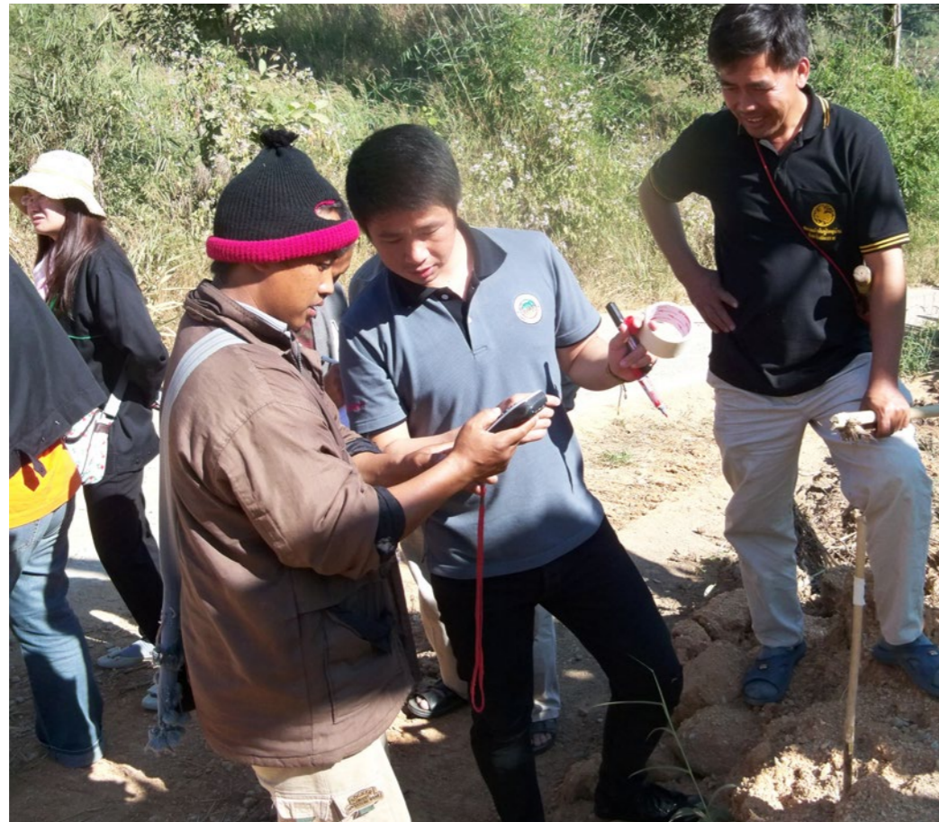
Utafiti wa ramani ya GPS, Thailand.

“ GTANW inataka kudumisha uwezo wa bayoanuwai na mifumo ikolojia muhimu kupitia uboreshaji ya mfumo wa utawala wa kijamii na kieneo . ”