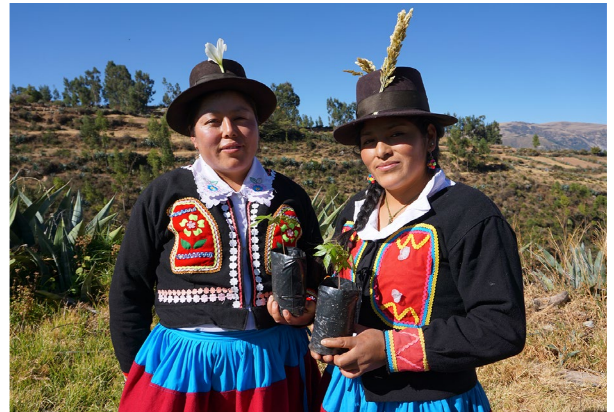
Waendelezaji wa mradi wa Transformative Pathways kutoka jamii ya Andean Quechua.

FPP ni Shirika la Usaidizi la Uingereza No. 1082158 (na kampuni yenye dhamana nchini Uingereza na Wales, nambari ya usajili 3868836).