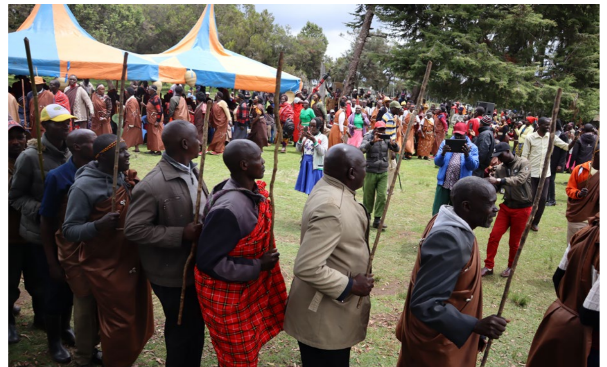
Jamii ya Ogiek ya Mlima Elgon, Kenya inaadhimisha Siku ya jamii asilia Ulimwenguni 2023 kwa wimbo na dansi.

Hatua hii imeundwa kwa uangalifu ili kukamilisha na kushirikiana na mitandao mipana, tunatarajia athari kutoka kwa shughuli za mradi kuenea zaidi ya muda wa mradi na nchi zinazohusika