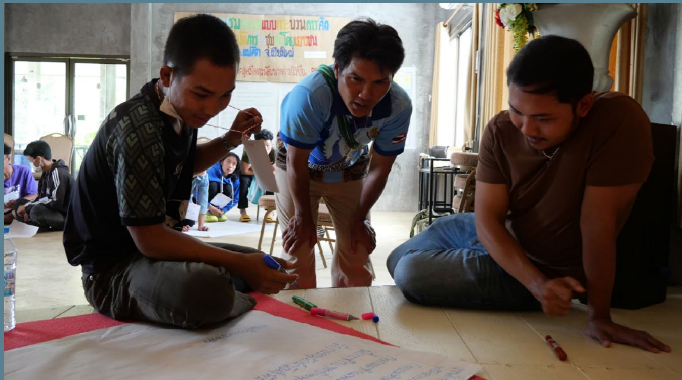
Kikao cha mawazo juu ya usimamizi wa rasilimali katika jamii.

Kazi nchini Thailand inalenga katika kuzalisha miundo mbalimbali ya usimamizi endelevu wa bayoanuwai. Hii inatokana na mwingiliano wa nguvu kati ya maarifa ya jadi na mbinu bunifu za kilimo ikolojia.