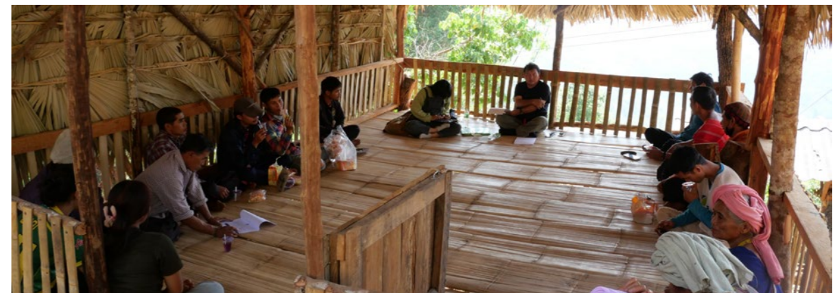
Mkutano wa Mradi wa Ban P Kalue.