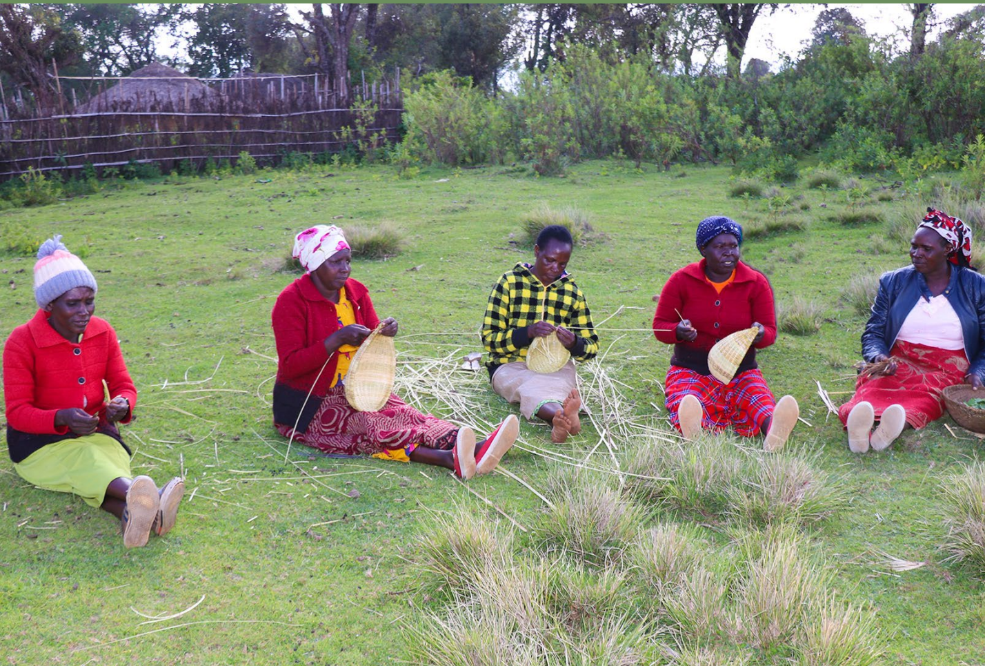
Wanawake wa Ogiek hujishughulisha na utengenezaji wa vikapu. Vikapu vya mianzi hubadilisha matumizi ya vifaa vya plastiki huko Chepkitale.

Kwa kufanya kazi na washirika wa kitaifa na washirika wa kimataifa, mradi huu unachochea ushawishi katika nafasi za sera za kimataifa. Inalenga ufuatiliaji na utoaji taarifa ndani ya CBD na kuripoti na uchanganuzi ndani ya IPBES haswa kupachika michango ya IPs na LCs ndani ya michakato hii.